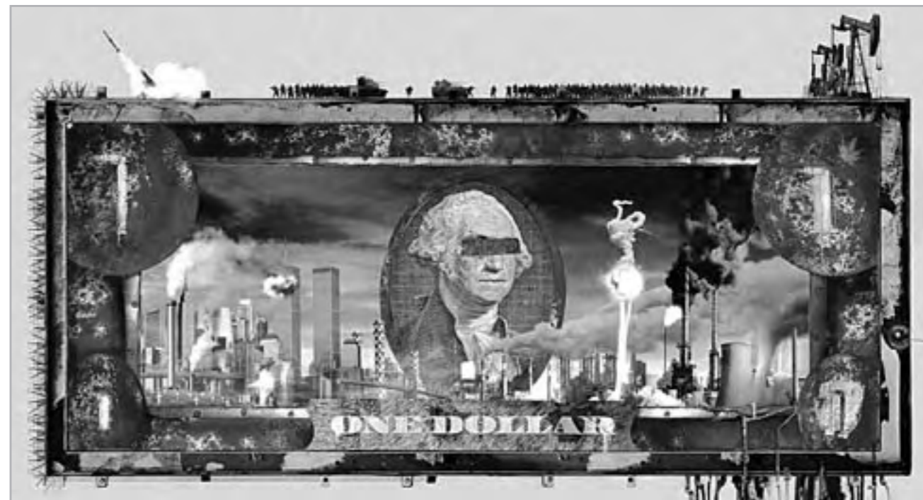
“El verdadero valor del dólar” creación de la agencia de publicidad JWT para un periódico del mercado financiero de São Paulo, Brasil..

Diferentes actores de la vida pública han esbozado sus apreciaciones, observándose opiniones que sostienen que la medida servirá para alimentar la fuga de divisas, como así también analistas que sostienen que la decisión se trata de una reivindicación muy significativa.