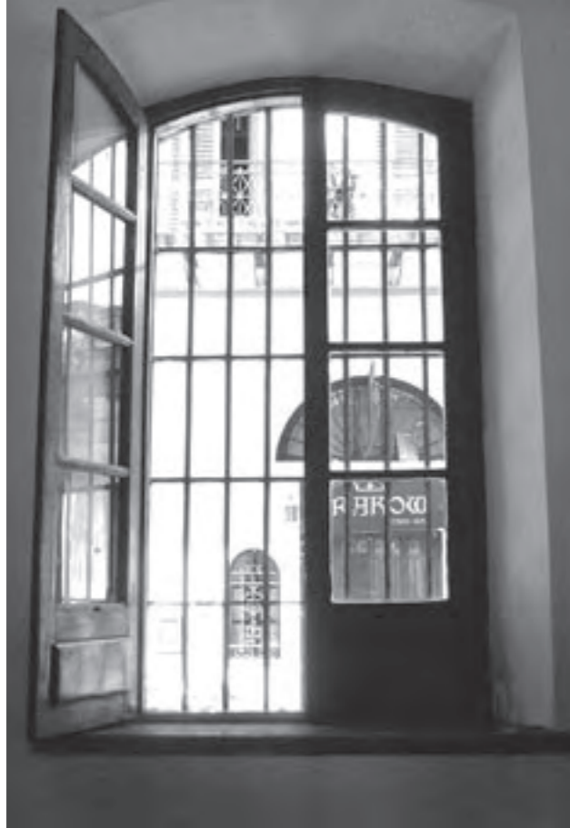
Ventanal de la Casa de Liniers

A través de un recorrido mágico realizado junto a los "fantasmas" que habitan las casas y relatan su historia centenaria, los porteños que asistan a las funciones de "Secretos de dos casas con historia" podrán ponerse en contacto con la legendaria casa del Virrey Liniers y sus dos siglos de historia (desde las invasiones inglesas y la rendición de Beresford hasta la promulgación de la Ley Sáenz Peña) y con lo ocurrido en lo que fuera la sede de la ex Editorial Estrada.