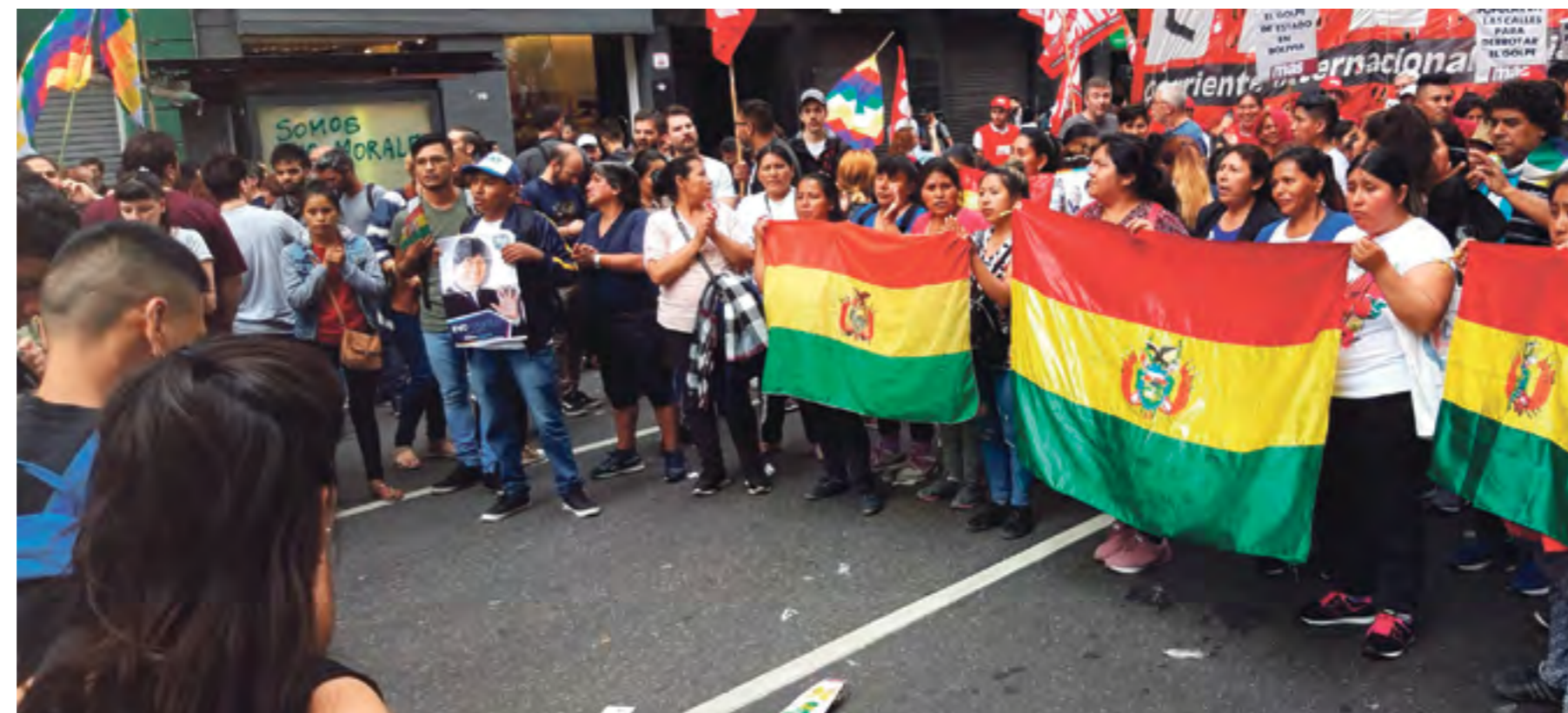
Integrantes de la comunidad boliviana en Buenos Aires –que votaron ampliamente al Partido de Evo Morales y Álvaro García Linera– marchan en repudio al golpe

En el caso de Santa Cruz organizan hordas motorizadas 4x4 con garrote en mano a escarmentar a los indios, a quienes llaman "collas", que viven en los barrios marginales y en los mercados. Cantan consignas de que "hay que matar collas", y si en el camino se les cruza alguna mujer de pollera la golpean, amenazan y conminan a irse de su territorio. En Cochabamba organizan convoyes para imponer su supremacía racial en la zona sur, donde viven las clases menesterosas, y cargan –como si fuera un destacamento de caballería– sobre miles de mujeres campesinas indefensas que marchan pidiendo paz. Llevan en la mano bates de béisbol, cadenas, granadas de gas; algunos exhiben armas de fuego. La mujer es su víctima preferida; agarran a una alcaldesa de una población campesina, la humillan, la arrastran por la calle, le pegan, la orinan cuando cae al suelo, le cortan el cabello, la amenazan con lincharla, y cuando se dan cuenta de que son filmadas deciden echarle pintura roja simbolizando lo que harán con su sangre.