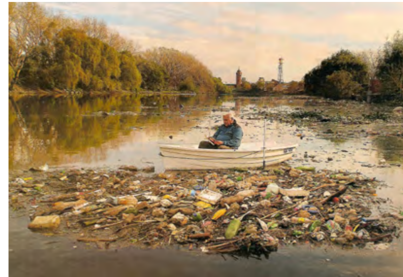
Riachuelo, foto 2009